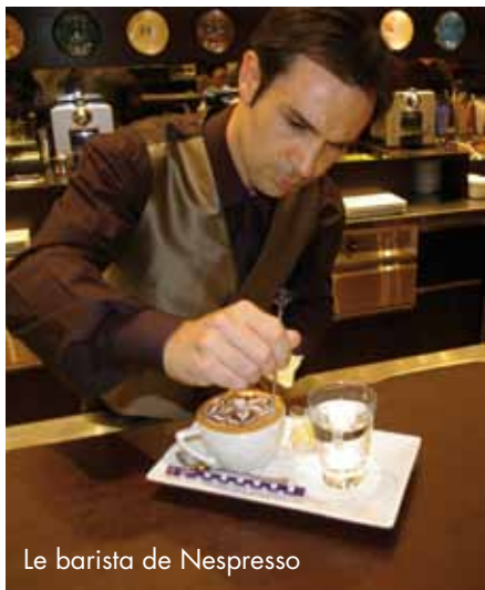
Le barista de Nespresso