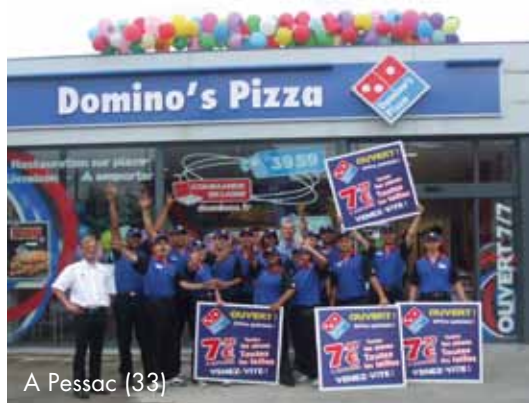
A Pessac (33)

Le leader de la pizza livrée en France a encore ouvert de nouveaux points de vente cet été.